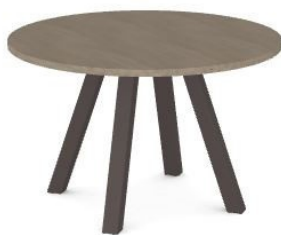
Table Noa stratifié avec plateau rond et structure métal. Le piètement est en acier peint époxy 7 x 7 cm et l'armature en aluminium peint époxy.

Cette fiche produit est générique. Le produit étant configurable, nous vous invitons à vous rendre sur notre site luisina.com pour découvrir tous les coloris et matériaux disponibles sur ce modèle